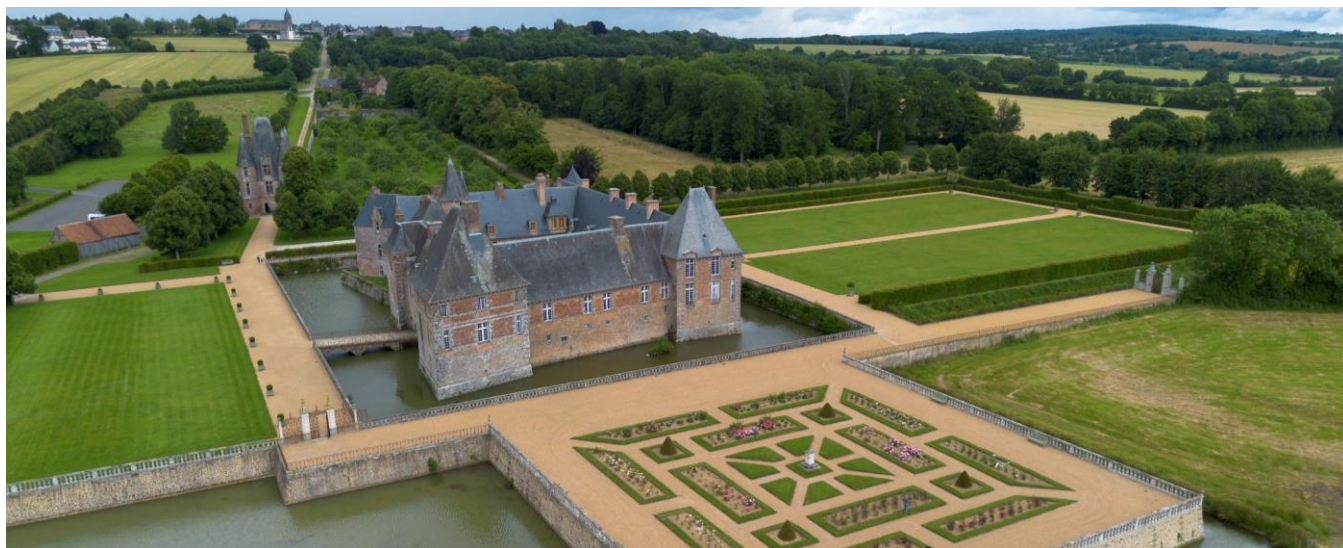
Le château de Carrouges vu du ciel

Après deux années déjà exceptionnelles (30 000 visiteurs en 2023 et 33 000 en 2024), le Château de Carrouges dans l'Orne bat un nouveau record en 2025 avec 34 000 visiteurs . Le succès d'un monument national qui a su se réinventer.