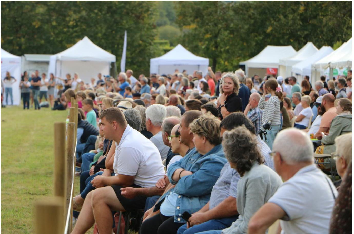
L'évènement « A cor et à cri » en septembre 2025 a rassemblé plusieurs milliers de personnes au Château de Carrouges

C'est cette double promesse, à la fois offrir une expérience hors du commun en faisant vivre le temps d'une journée la « vie de château » et être un service public de proximité , un lieu ancré dans le quotidien des habitants, que les équipes du monument vont s'employer à tenir.