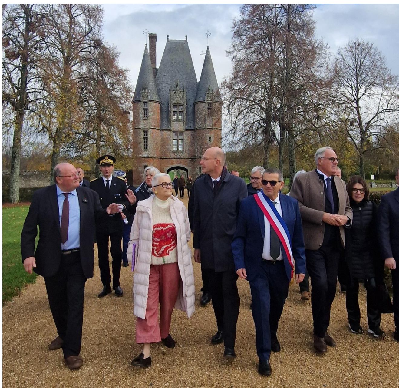
Visite ministérielle au Château de Carrouges le 31 octobre 2025

Des visiteurs « extraordinaires » pour le château et dont le déplacement à Carrouges est une vraie reconnaissance de l'engagement et du travail des agents du Centre des monuments nationaux.