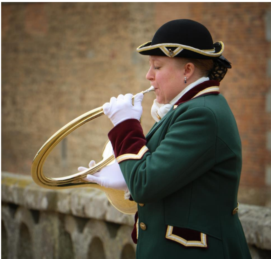
L'évènement « A cor et à cri » en septembre 2025 au Château de Carrouges