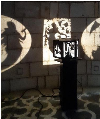
Carrousel d'ombres « Mélusine» et gravure en relief © Colas Reydellet